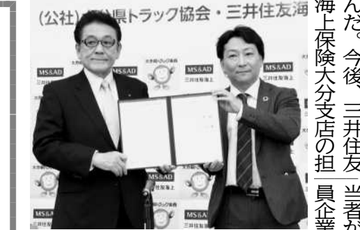
（公社）大分県トラック協会・三井住友海上火災保険大分支店

南海電鉄は、グループ企業を対象にした大阪府立心和中区のeスタジアム（大阪市）で、中学校との共同施策で、eスポーツ施設が、中学校の出席「プ3・0」時代に必要知識を身に付け、体験する。不登校生向けに、eスポーツ施設が、中学校の出席「プ3・0」時代に必要知識を身に付け、体験する。